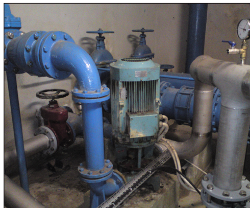
Dåvarande tryckstegringslösning för vattenförsörjning till 250 hushåll i Smedjebacken. En äldre pump på 22 kW.