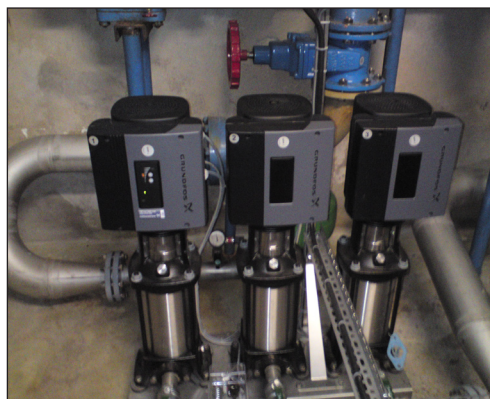
Vattenverkets nya lösning - Grundfos Hydro Multi-E tryckstegringsystem med 3 energieffektiva CRE 10-9 centrifugalpumpar på vardera 3 kW, med integrerad varvvalsreglering.